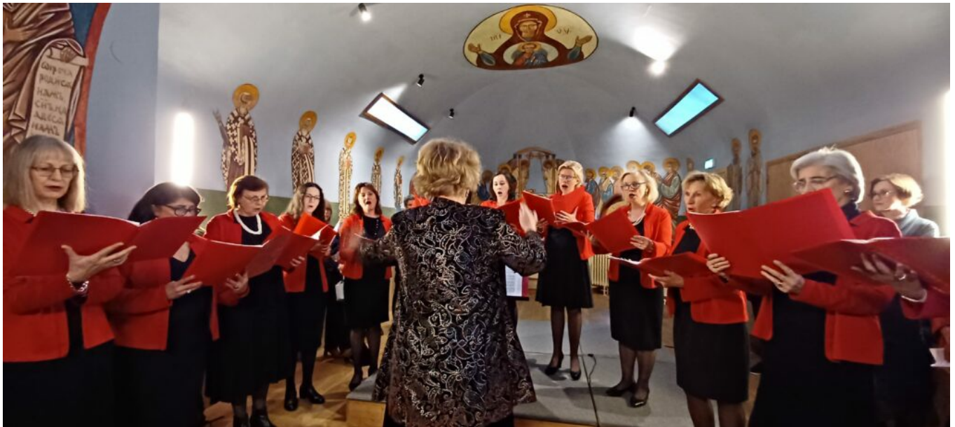
Concert de l'ensemble vocal Slava

Ensuite, tout au long du week-end, pas moins 2 000 visiteurs se sont rendus au Potager du Dauphin. Visites commentées de la chapelle, conférences, exposition, visite des ateliers des artisans, animations musicales et concerts étaient au programme de ce week-end.