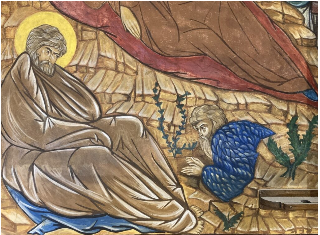
Fresque de la chapelle Saint-Georges

Ensuite, tout au long du week-end, pas moins 2 000 visiteurs se sont rendus au Potager du Dauphin. Visites commentées de la chapelle, conférences, exposition, visite des ateliers des artisans, animations musicales et concerts étaient au programme de ce week-end.