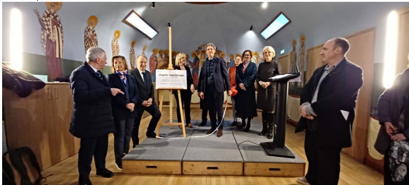
Inauguration de la chapelle Saint-Georges du Potager du Dauphin

Ce week-end inaugural a débuté en beauté avec l'inauguration officielle et d'un concert de l'ensemble vocal féminin Slava, en présence de 150 meudonnais !