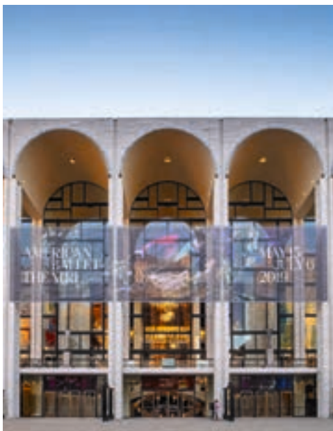
MET Opera

Potager du Dauphin Cycle 17 de quatre conférences: TP 23,20 € | TR 8 €