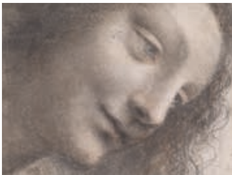
Léonard de Vinci, Tête de la Vierge de trois quarts à droite, 1508-1512, New York