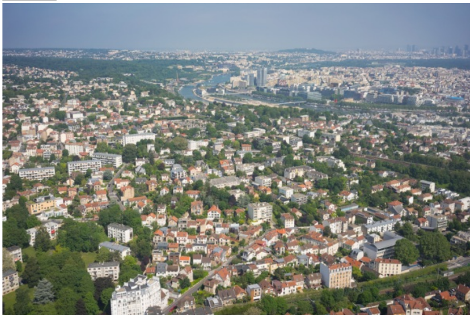
Meudon Centre / Val-Fleury